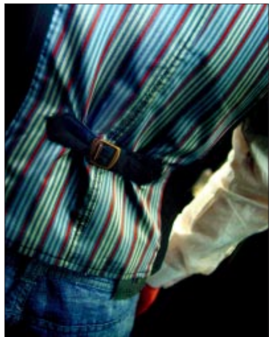
Het getailleerde overhemd valt mooi om het lichaam.