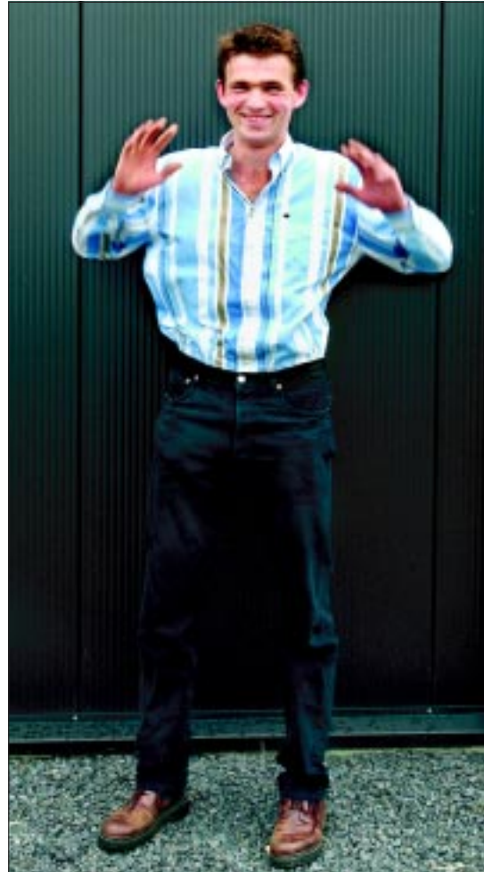
Haye zoals hij binnekam.

Aan deze productie werkten mee: haarstylist Derk Boltendal (06-51991420), Lijsbeth Brons van Beautystudio4u in Peize (www.beautystudio4u.nl), Marije Gerdes van Dap-Styling in Groningen (www.dap-styling.nl) en in pEtto mannenmode, Zwanestraat 14 in Groningen (inpetto-mannenmode.nl). Reageren kan via pimpdelezer@dvh.nl